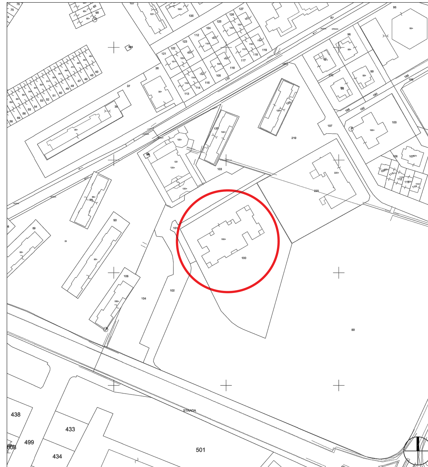
ESTRATTO MAPPA CATASTALE FG. 138, MAPP. 100

File F:\DATI\Disegna3\Nuovo Archivio 2004\ D-E-F-G) Edif.scot1-Nidi-DID-08-Melarancia (Via Atene 3) EX-Bollitoro\08-Prog-22-20_Tinteppi_Pavimnti\22-20_MANUT_Pavim_Tinteppi.dwg