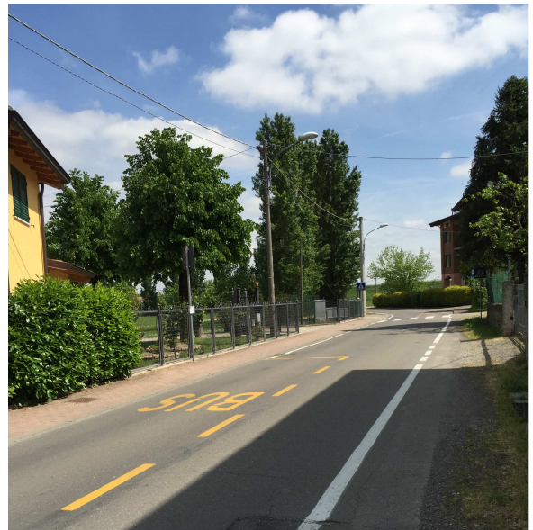
62U-04 FERMATA AUTOBUS