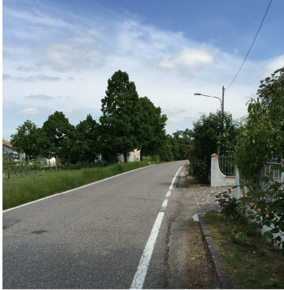
63U-05 FINE MARCIAPIEDE