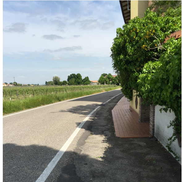
63U-02 MARCIAPIEDE STRETTO