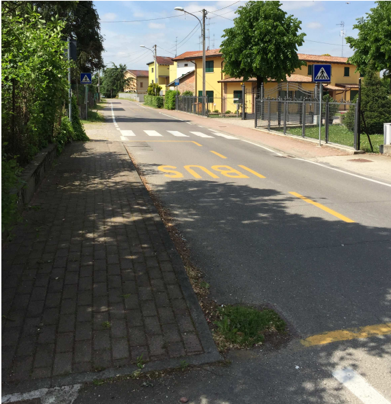
62U-01 DIREZIONE SUD