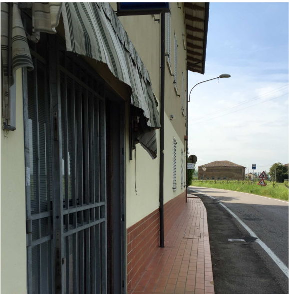
63U-03 CON DISLIVELLI