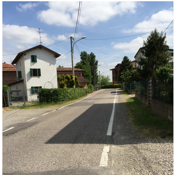
63U-08 VISTA TRATTO SENZA MARCIAPIEDI