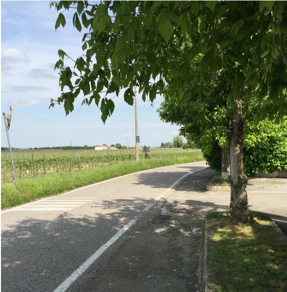
63U-01 DIREZIONE NORD