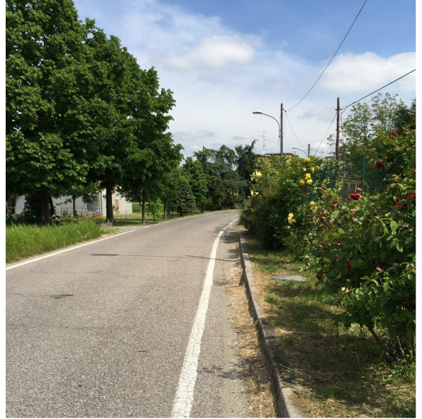
63U-06 TRATTO SENZA MARCIAPIEDE