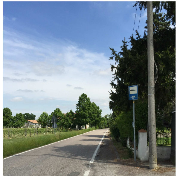
63U-04 FERMATA AUTOBUS