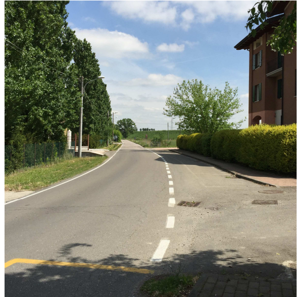
62U-02 MARCIAPIEDE SOLO AD UN LATO