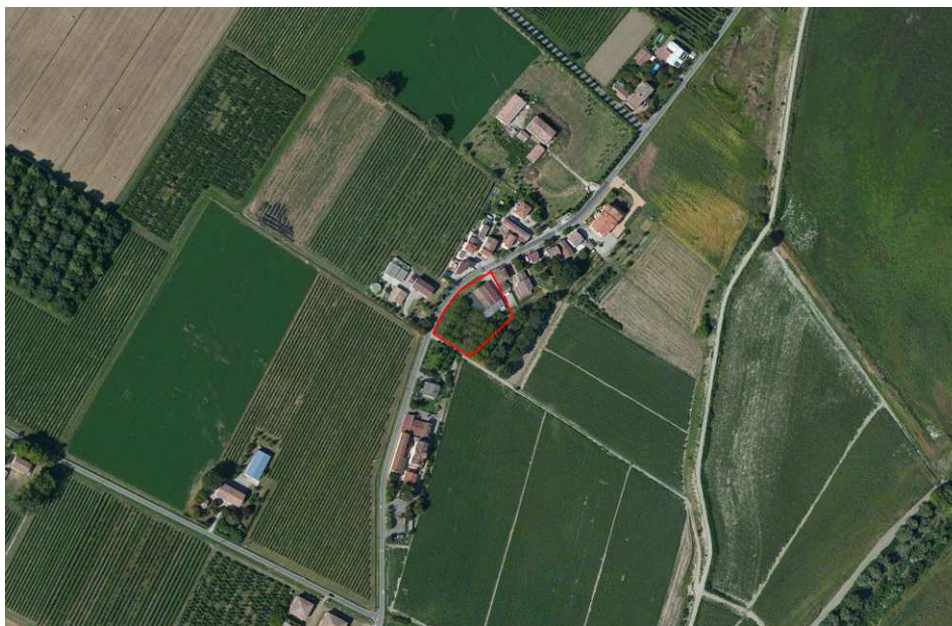
Localizzazione dell'area oggetto di Variante su ortofoto digitale