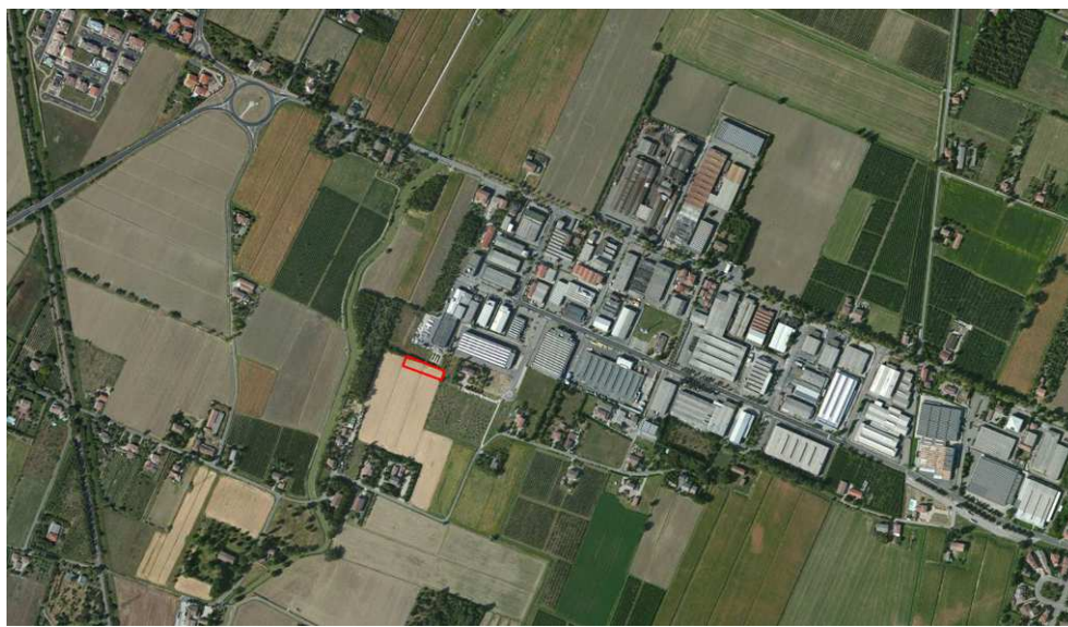
Localizzazione dell'area oggetto di Variante su ortofoto aerea

A causa della forma, della limitata estensione e risultando di altra proprietà rispetto ai lotti produttivi limitrofi, l'area non presenta caratteri di edificabilità indipendente: fra l'altro il terreno è privo di qualsiasi servizio di urbanizzazione primaria e di accesso viario e si configura come frangia urbana. Questo determina anche per i proprietari l'impossibilità di valorizzare la potenzialità edificatoria dell'area, a fronte di oneri certi (IMU).