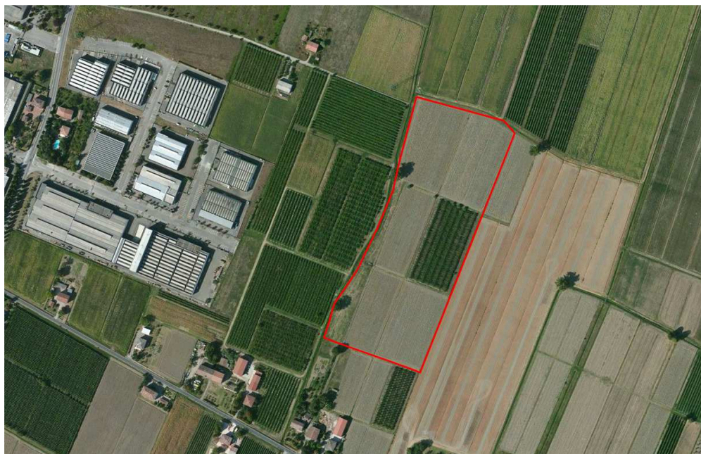
Localizzazione dell'area oggetto di Variante su ortofoto aerea

La modifica, che interessa la porzione di ambito a più diretto contatto con il territorio agricolo a est (in riva destra) del cavo Arginetto comporta la riclassificazione delle aree stralciate da 'Nuovo ambito specializzato per attività produttive prevalentemente secondarie' a 'Zona agricola E'; con il nuovo confine est del comparto che si attesterà sul cavo Arginetto e che consente comunque il mantenimento di una significativa riserva di aree a destinazione produttiva in quella localizzazione. I terreni sono identificati al catasto, al foglio 42, mappali 171, 547, 549, 675, 678, 680. L'area interessata ha superficie territoriale complessiva pari a 58.649 mq circa (su un totale dell'ambito di circa 117.656 mq), cui corrisponde una riduzione di Sc a destinazione produttiva pari a ca 23.460 mq.