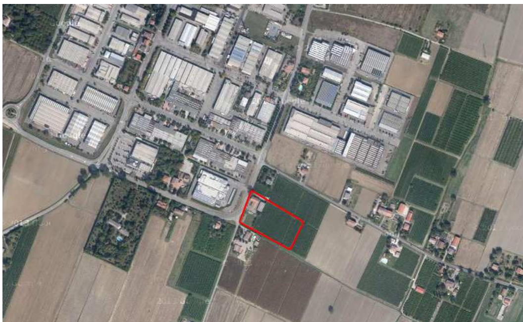
Localizzazione dell'area oggetto di Variante su ortofoto digitale

L'area attualmente agricola, ha forma regolare, pressochè rettangolare ed è posta in continuità con i tessuti produttivi a sud del capoluogo. Essa è servita direttamente da via Morello di Mezzo, strada già utilizzata dal comparto produttivo, che si presenta adeguata ad accogliere il traffico veicolare indotto.