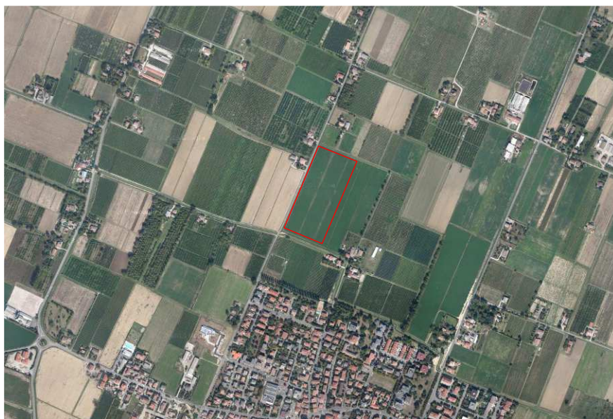
Localizzazione dell'area oggetto di Variante su ortofoto digitale